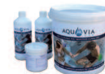
Kit de désinfection

Dans le cadre de notre politique d'améliorations constantes, nous nous réservons le droit de modifier/d'amender nos spécifications n'importe quand et sans aucun préavis.