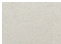
72 Pearl Cameo