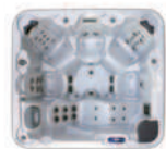
Futura 40 ref: 36624