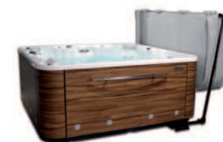
Accessoire idéal pour ramasser en toute commodité la couverture de votre Spa.