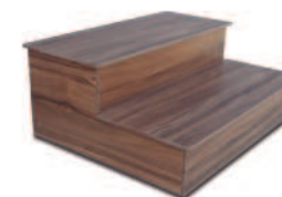
Escalier NOYER (ou GRAPHITE modèle)